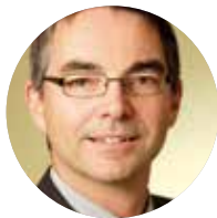
Thomas Traub Planer- und Architektenbe- treuung ISOVER